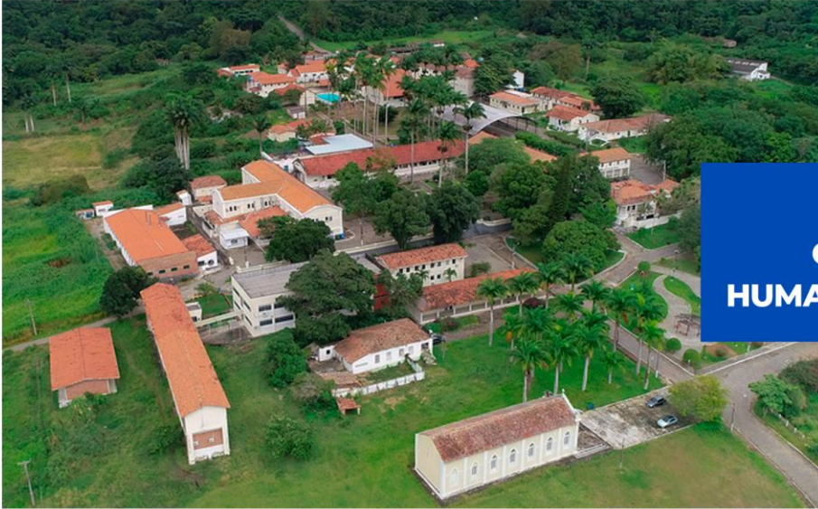
VISÃO ÁEREA DO CENTRO DE CIÊNCIAS HUMANAS, SOCIAIS E AGRÁRIAS